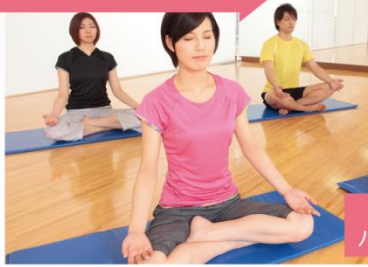
トレーニング・ヨガ