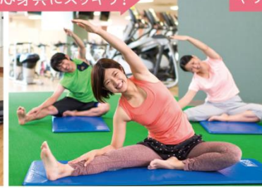
ストレッチ・ヨガ